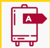
Sostituzione Impianti Termici